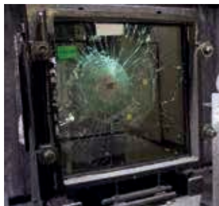
Der Polycarbonatkern hält Beschuss, Sprengungen und Einbruchversuchen stand.

Sicurtec baut nach eigenen Angaben Glas und Polycarbonat – und eventuell noch mal Glas – bei einem Abstand von jeweils zwei Millimeter zu einem Sandwich zusammen. Dieses befüllt das Unternehmen mit flüssigem, glasklarem, mehrkomponentigem Polyurethan, welches eigens für dieses Verfahren entwickelt sei –