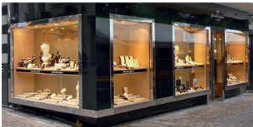
Die angriffshemmenden Sicherheitsgläser von Sicurtec eignen sich z.B. für Schau- fenster, Türen und Vitrinen in Schmuckgeschäften.

Das österreichische Unternehmen Sicurtec stellt Sicherheitsgläser mit Polycarbonatkern her. Im Vergleich zu herkömmlichen Nurglas-Mehrscheibenverbänden mit PVB-Folien sind diese bis zu 60 Prozent leichter und 40 Prozent dünner – bei gleichzeitig wesentlich höherer Rückhaltefähigkeit.